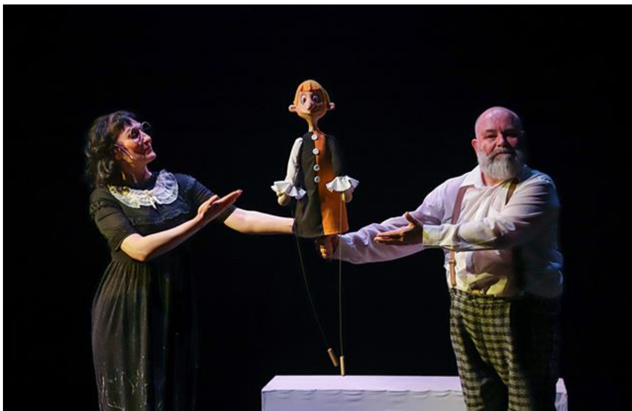
Сцена из эскиза «Маяковский. Опера».